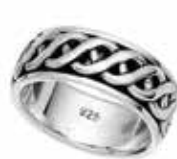
Primjer oznake čistoće na prstenu od srebra stupnja čistoće 925/1000:

Oznaka čistoće je troznamenasta brojana vrijednost koja odgovara jednom od propisanih stupnjeva čistoće.