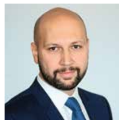
Mihael Zmajlović ministar zaštite okoliša i prirode

Po očuvanoj prirodi Hrvatska je među najbogatijim zemljama Europe. S pravom i ponosom možemo reći - Hrvatska je nacionalni park Europe. Trećina našeg teritorija je dio najveće svjetske mreže zaštićenih područja, ekološke mreže Natura 2000. Po nazivom Parkovi Hrvatske okupljamo 8 nacionalnih parkova i 11 parkova prirode. Svaki je jedinstven. I sve ih se isplati obići u što se uvjeri 2,7 milijuna posjetitelja koliko ih parkovi godišnje privuku.